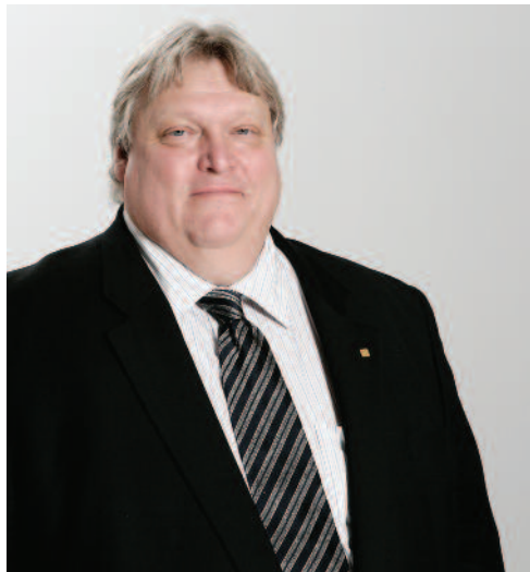
Dr Gaétan Barrette

Président de la Fédération des médecins spécialistes du Québec